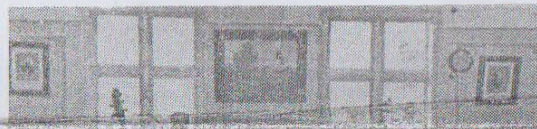
Ar tautu birstību un mīlesti-

Vai tad var uzskaitīt visus čaklos un apzinīgos bērnus?