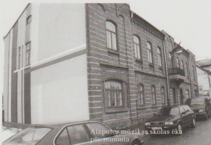
Aizputes mūzikas skolas ēka pēc remonta

2005. gads jau lieliem soļiem uzsācis savu skrējieni. Spraiga darba pilns Liepājas rajona lielākajai un senākajai daļai – Aizputes mūzikas skolai sākās 2004./2005. mācību gads. Mūzikas skolā pašlaik mācās 126 audzēkņi gan no Aizputes, gan apkārtnējiem pagastiem, ir 16 pedagogu liela saime.