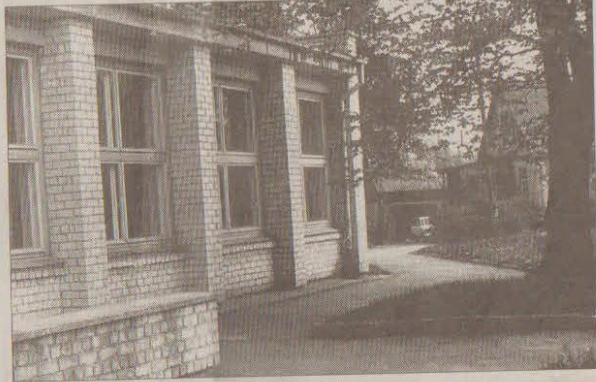
Aiz šiem logiem skanošajā Kuldīgas ielas namiņā pirmās iemaņas muzicēšanā guvis ne viens vien aizputnieks, kurš vēlāk kļuvis par profesionālu mūziķi.